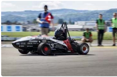
VIDEO - Le record du monde du 0 à 100 km/h est...