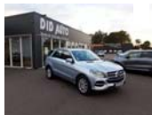
Mercedes Classe GLE

Le karting ne cesse de gagner en popularité à travers le monde. Que ce soit pour les amateurs en quête de sensations fortes ou pour les futurs champions en herbe, le karting offre une expérience de conduite unique. Avec des karts de plus en plus performants, capables d'atteindre des vitesses