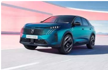
PHOTOS - Nouveau Peugeot E-3008, l'électrique...