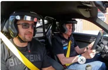
VIDEO - A 76 ans, Walter Röhrl s'éclate encore...