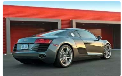
PHOTOS - Supercars et sportives cool d'occasion...