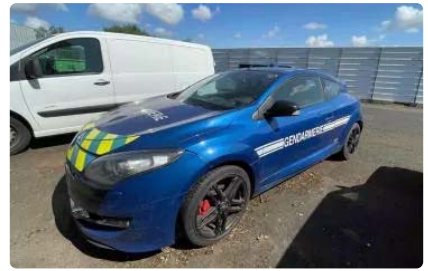
Malgré son état, cette Renault Megane R.S. de...