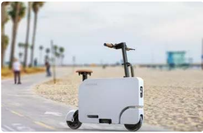
Honda dévoile son scooter électrique à moins...