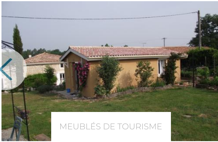
MEUBLÉS DE TOURISME