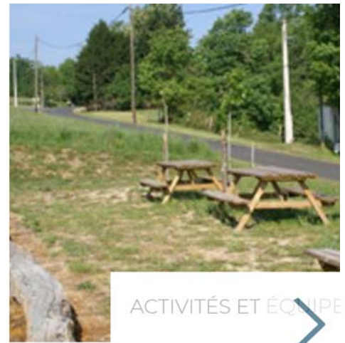
ACTIVITÉS ET ÉQUIPE

Nous utilisons des cookies à des fins statistiques et pour vous fournir du contenu personnalisé. ×