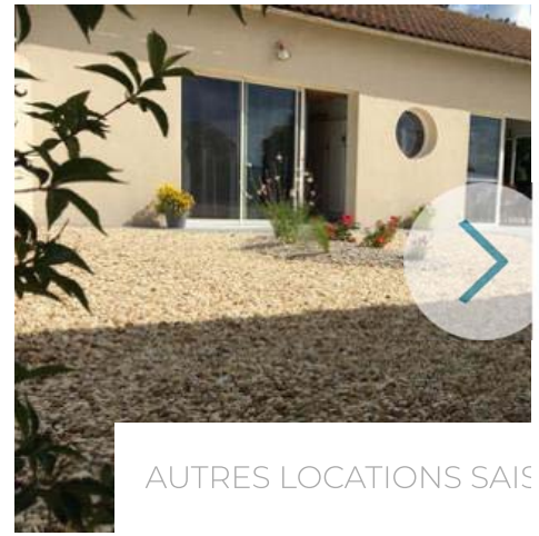
AUTRES LOCATIONS SAIS