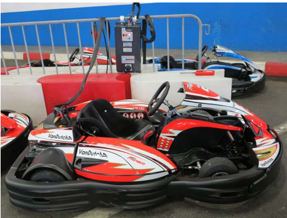
Les nouveaux karts électriques Sodikart : plus performants en indoor que ceux à moteur thermique 270cm 3 , 4 temps.

En Minikart, champion de ligue Provence-Alpes-Côte d'Azur Corse du Comité régional de karting de la Fédération française du sport automobile ; en X30, vice-champion de ligue ; en NSK-X30, champion de France et 3e du Challenge européen Shifter ; 4e du Challenge européen X30 ; 3e de la finale mondiale X30 et 4e de la finale mondiale Shifter ; victoire en KZ125 et podium 100% Team Monaco au Grand Prix de Menton.