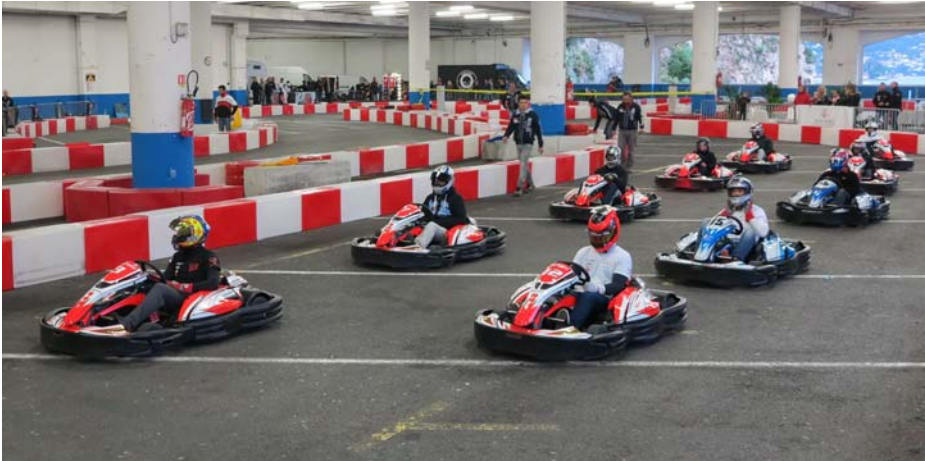
Juste avant le départ d'une manche du 1er Carabiniers Karting Trophy en faveur de Fight Aids à Kart Indoor Monaco.

La journée inaugurale de ce nouveau temple du karting loisir avait été mise sur roues le dimanche 9 novembre par les Carabiniers du Prince en faveur de l'association Fight Aids Monaco. Laquelle, fondée et présidée voici dix ans par SAS la Princesse Stéphanie, apporte sa pierre à l'édifice de la lutte contre le Sida.